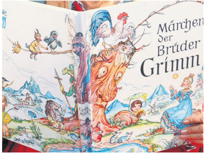
Eine Hommage an Jacob und Wilhelm Grimm und deren Märchen ist das diesjährige Musical der Brüder-Grimm-Festspiele „Jacob und Wilhelm – Weltenwandler“.

Was geschieht, wenn die Grenzen zwischen dem Reich der Märchen und der realen Welt durchlässig werden? Was wäre, wenn die eine Welt nicht ohne die andere könnte? Antworten auf diese Fragen gibt die fantastische Geschichte „Jacob und Wilhelm – Weltenwandler“, die am 10. Mai die 35. Saison der Brüder-Grimm-Festspiele als Musical eröffnet.