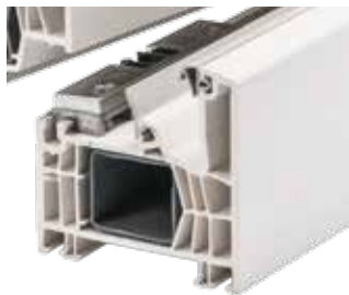
Baureihe 76 auch mit Mitteldichtung erhältlich

Rollende Komfort-Pilzbolzen greifen in einbruchhemmende Sicherheitsschließteile (hochfeste Kombination aus glasfaserverstärktem Kunststoff und Stahl), die im Stahl verschraubt sind.