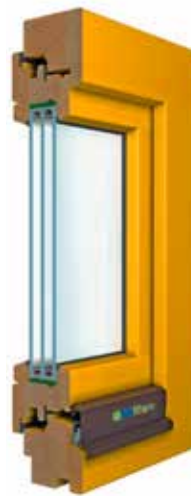
WIN 80 Classic auch mit profiliertem Flügel erhältlich