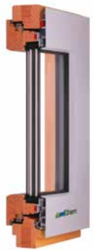
WIN 80 Integral