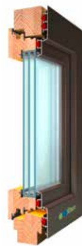
WIN 80 Trend